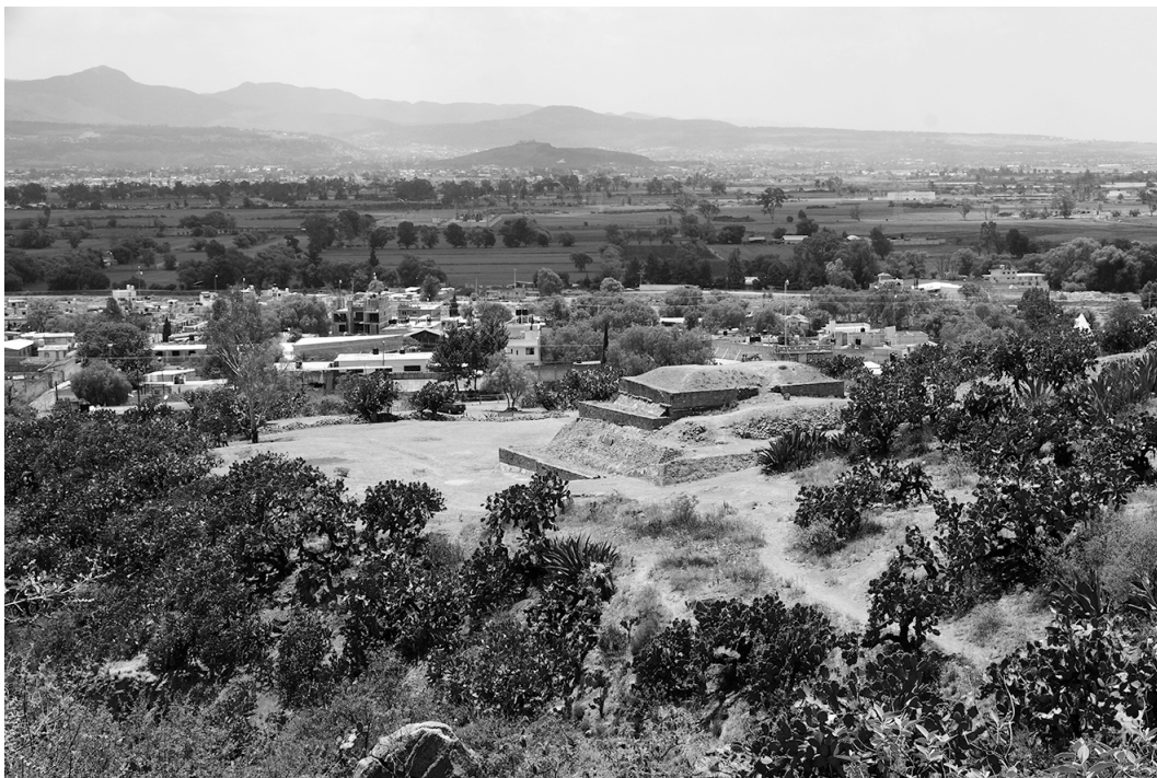
Figura 2. Estructura prehispánica de Huapalcalco en su contexto