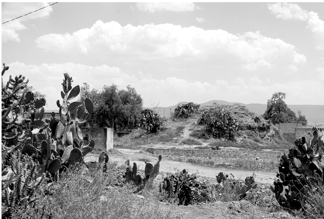
Figura 3. Estructuras piramidales cubiertas con vegetación