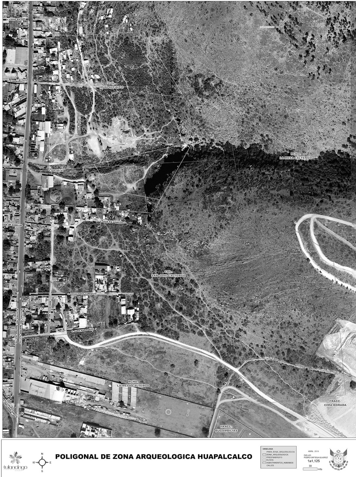
Figura 1. Poligonal de la Zona Arqueológica de Huapalcalco (2013)