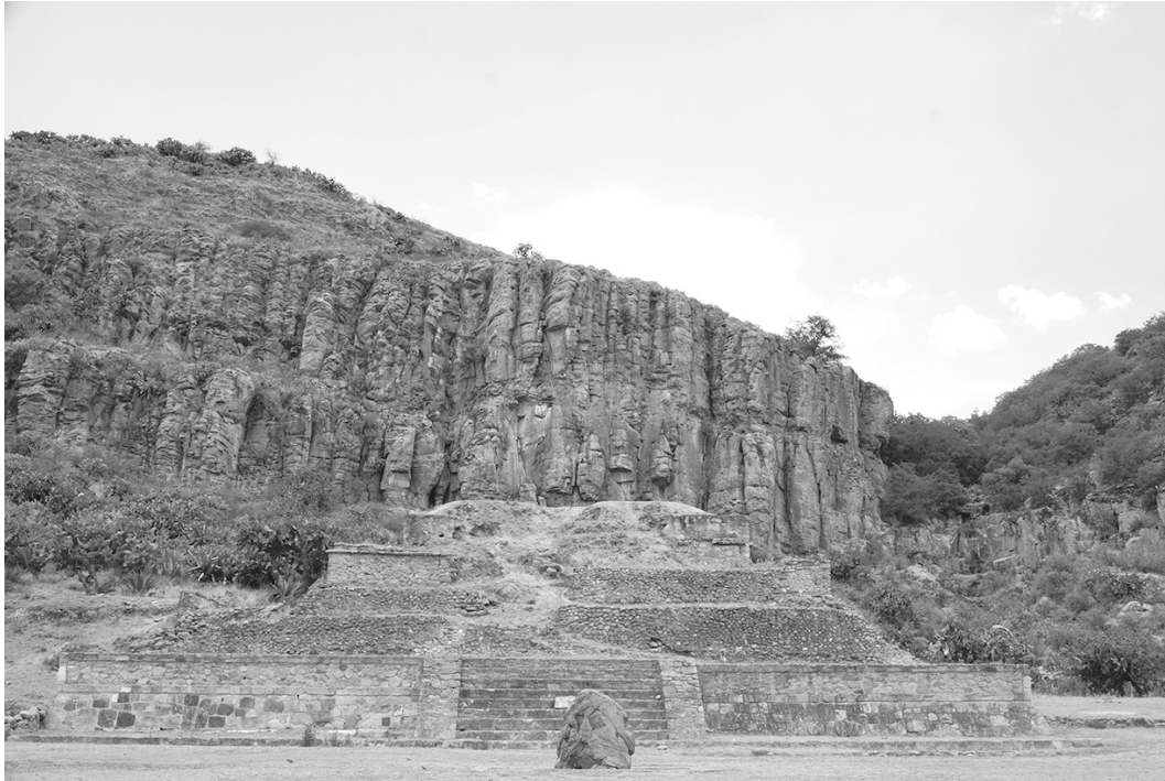
Figura 1. Estructura principal rescatada en Huapalcalco