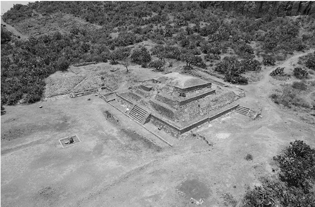
Figura 6. Vista aérea de la estructura principal rescatada en Huapalcalco