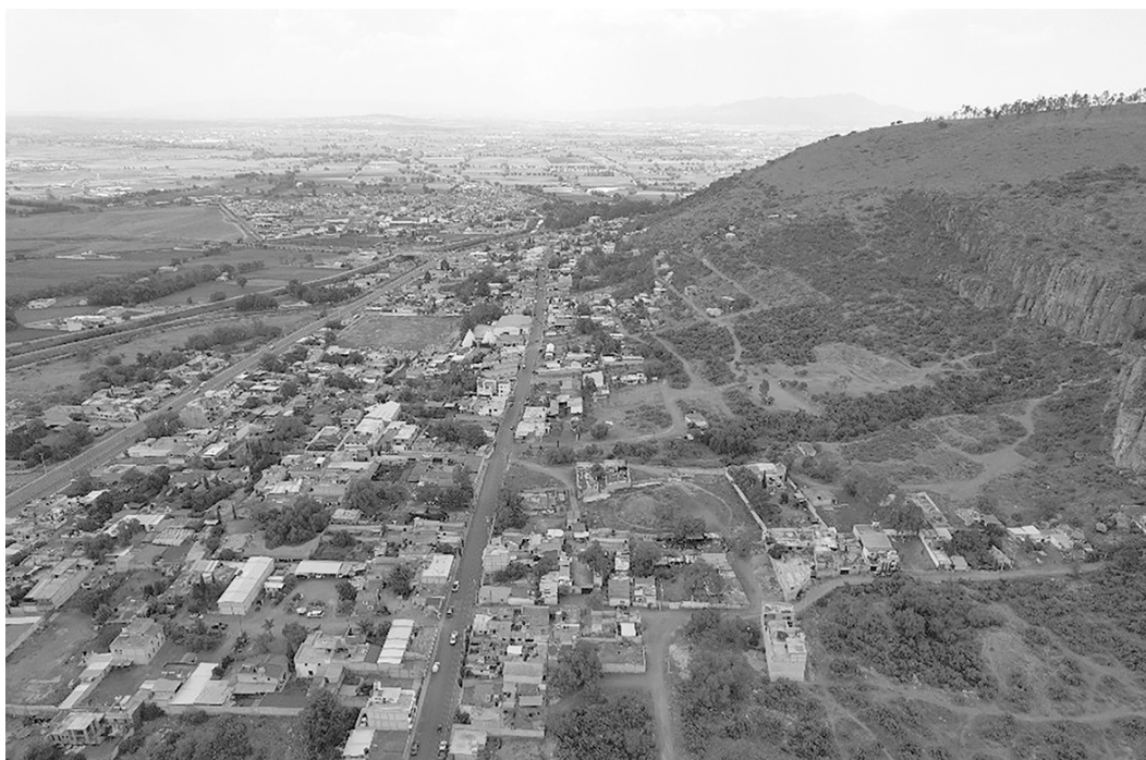
Figura 4. Huapalcalco y el crecimiento suburbano de su entorno