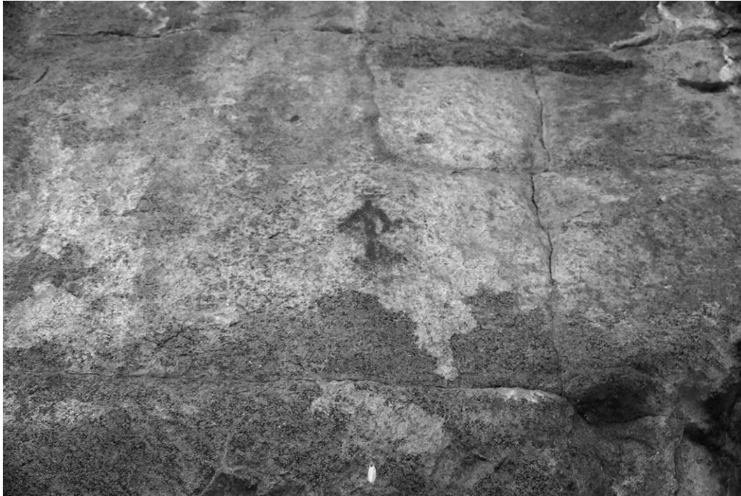
Figura 7. Pintura rupestre de los Cerros del Huiztle y la Mesa