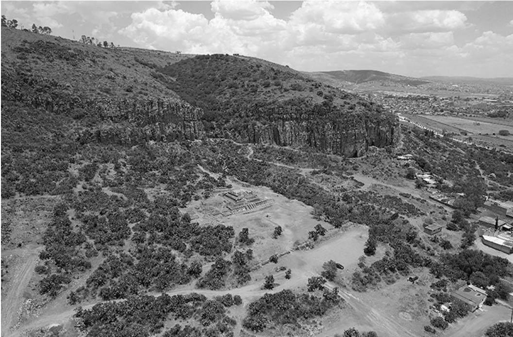
Figura 5. Vista del área de Huapalcalco